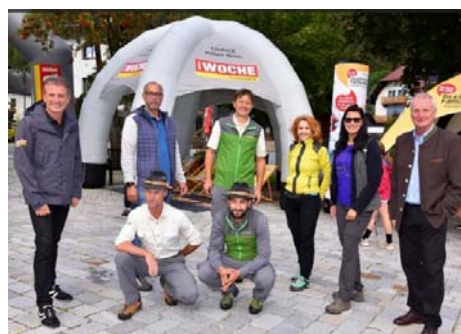
Bürgermeister BR Günther Novak