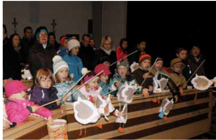
Trotz des Dauerregens am 11. November kamen zahlreiche Kinder mit ihren Eltern und ihren selbstgebastelten Laternen in die Kirche, wo eine stimmungsvolle Andacht mit Laternenumzug stattfand.