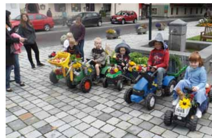
Das heurige Erntedankfest wurde unter kräftiger Mit-hilfe der jungen Mallnitzer Bäuerinnen und Bauern mitgestaltet. Auf ihren riesigen Traktoren umrundeten sie den Brunnen am Dorfplatz und führten dann den Festzug in die Christkönigskirche an.