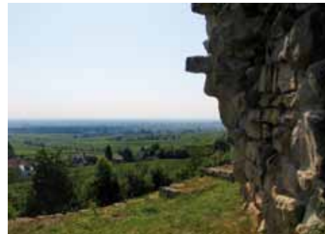
Unser jetziger Wohnsitz – Wachenheim an der deutschen Weinstraße in der Nähe von Mannheim

Wir für uns können nur sagen, dass wir geprägt durch unsere Erlebnisse, viel von unserer Hei-