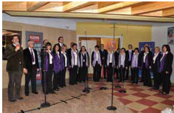
Nach zahlreichen Proben präsentierte sich der Christkönigschor Mallnitz bei der Vorausscheidung der Veranstaltung „Chor des Jahres“ mit einem Programm, das von der Jury als „sehr gut“ bewertet wurde. Herzliche Gratulation!