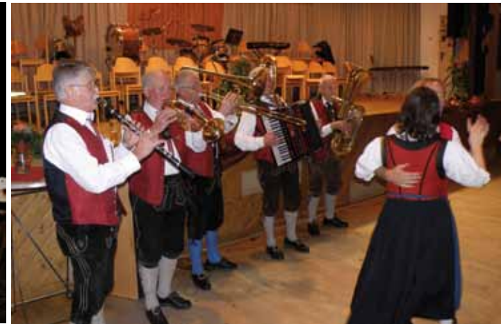
Beim diesjährigen Mallnitzer Kirchtage spielten die Alten Mallnitzer zum Tanz auf. Den Gästen wurden von den heimischen Vereinen viele Köstlichkeiten wie Schweinsbraten, Kirchtagegsuppe, Leberkäs, Jausenbrote, Torten und Krapfen angeboten.