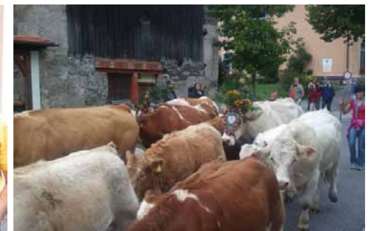
Der Almabtrieb im September lockte wieder viele Gäste an und ist mittlerweile fixer Bestandteil im Mallnitzer Veranstaltungskalender. Die reichhaltige Bewirtung fand am Parkplatz bei der Gemeinde Mallnitz statt.