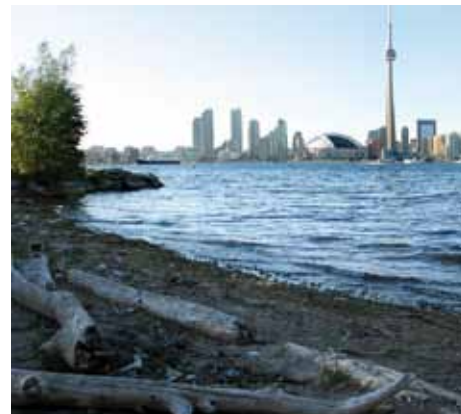
Einige Jahre zuvor – Arbeiten und Wohnen in der 2,6 Millionen Stadt Toronto

mat in uns tragen und dies auch instinktiv leben und weitergeben, wo auch immer wir gerade sind. Man sagt, der Charakter eines Menschen wird durch das Umfeld geprägt, in dem man aufwächst und lebt. Aus unserer Sicht beeinflussen uns nicht nur unse-