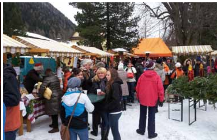
Bei winterlich kaltem Wetter tummelten sich am ersten Adventssonntag viele Mallnitzerinnen und Mallnitzer im Park und genossen bei der stimmungsvollen Waldweihnacht der Naturfreunde Mallnitz die dargebotenen Speisen und Getränke und das attraktive Kaufangebot.