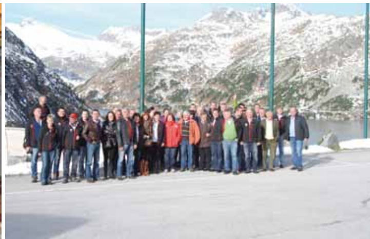
Ende Oktober verbrachte die FF-Mallnitz, aktive Kameraden, Altkameraden, Helfer sowie deren PartnerInnen einen interessanten und gemeinschaftlichen Tag bei der Besichtigung der Kölnbreinsperre sowie anschließend in der Gmündner Hütte.